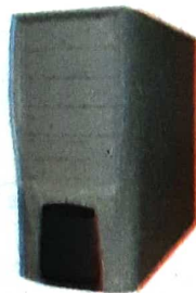
سی پی یو