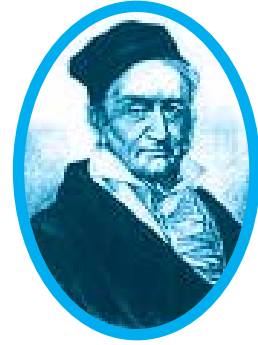
कार्ल फ्रैड्रिक गॉस (1777 – 1855)

अंकगणित की आधारभूत प्रमेय के रूप में विख्यात होने से पहले, प्रमेय 1.2 का संभवतया सर्वप्रथम वर्णन यूक्लिड के एलीमेंट्स की पुस्तक IX में साध्य (proposition) 14 के रूप में हुआ था। परंतु इसकी सबसे पहले सही उपपत्ति कार्ल फ्रैड्रिक गॉस (Carl Friedrich Gauss) ने अपनी कृति डिसक्विशंस अरिथमेटिकी (Disquisitiones Arithmeticae) में दी। कार्ल फ्रैड्रिक गॉस को प्रायः 'गणितज्ञों का राजकुमार' कहा जाता है तथा उनका नाम सभी समयकालों के तीन महानतम गणितज्ञों में लिया जाता है, जिनमें आर्किमिडीज़ (Archimedes) और न्यूटन (Newton) भी सम्मिलित हैं। उनका गणित और विज्ञान दोनों में मौलिक योगदान है।