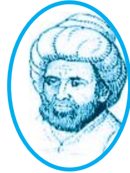
मुहम्मद इब्न मूसा अल-ख्वारिज़्मी (780 – 850 ई.)

प्रमेयिका एक सिद्ध किया हुआ कथन होता है और इसे एक अन्य कथन को सिद्ध करने में प्रयोग करते हैं।