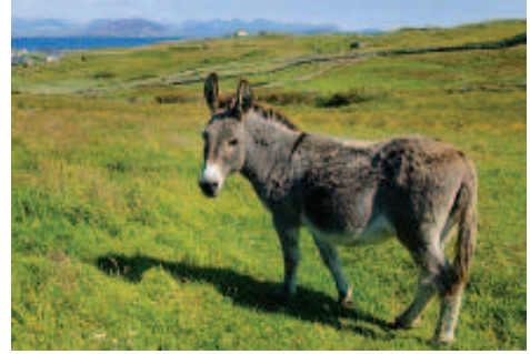
चित्र 9.2 खच्चर

यद्यपि कृत्रिम वीर्यसेचन की क्रिया को अपनाया जाता है फिर भी बहुधा परिपक्व नर तथा मादा पशुओं के मध्य होने वाले संगम से, उत्पन्न संकरण की दर से मिलने वाली सफलता कुछ कम ही होती है। संकरों के सफल उत्पादन में सुधार लाने के लिए अन्य विधियों का भी प्रयोग किया जाता है। मल्टीपिल औवियूलेशन, ऐम्ब्रयो ट्रांसफर (भ्रूण अंतरण) तकनीक गौ पशुओं में सुधार का एक कार्यक्रम है। इस विधि में, एक गाय में पुटक परिपक्वन तथा उच्च अंडोत्सर्जन को प्रेरित करने के लिए जब एफएसएच प्रकार का हॉर्मोन दिया जाता है। सामान्यतः प्रतिचक्र में एक अंडे की तुलना में 6-8 अंडे उत्पन्न होते हैं। पशु को या तो सर्वोत्कृष्ट साँड़ (बैल) अथवा कृत्रिम वीर्यसेचन द्वारा संगमनित कराया जाता है। 8-32 कोशिका अवस्थाओं वाले निषेचित अंडे को बिना शल्य चिकित्सा से प्राप्त कर प्रतिनियुक्त मादा (माँ) में स्थानांतरित कर दिया जाता है आनुवंशिक मादा (माँ) उच्च अंडोत्सर्जन के दूसरी पारी के लिए उपलब्ध हो जाती है। यह प्रौद्योगिकी गौपशु, भेड़, खरगोश, भैंस, घोड़ी आदि में प्रदर्शित की जा चुकी है। उच्च दुग्ध उत्पादन वाली नस्ल की मादाओं तथा उच्च गुणवत्ता वाले माँस (कम वसा वाला माँस) प्रदान करने वाली नस्लों के बैलों को सफलतापूर्वक जनित किया गया है, जिससे अल्प काल में ही बड़ी संख्या में गौपशु प्राप्त हुए हैं।