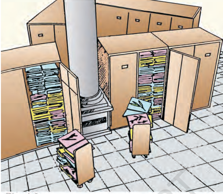
चित्र 1.2 वनस्पति संग्रहालय में पौधों के एकत्रित नमूने