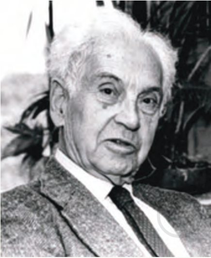
एरनस्ट मेयर (1904 - 2004)

एरनस्ट मेयर का जन्म 5 जुलाई, 1904 में केंपटन, जर्मनी में हुआ था। आप हावर्ड विश्वविद्यालय के विकासपरक जीव वैज्ञानिक थे, जिन्हें '20वीं शती का डार्विन' कहा गया। आप अब तक के 100 महान वैज्ञानिकों में से एक थे। मेयर ने सन् 1953 में हावर्ड विश्वविद्यालय की कला एवं विज्ञान संकाय में नौकरी प्राप्त की और 1975 में एलेक्जेंडर अगासीज प्रोफेसर ऑफ जुलोजी एमीरिटस की पदवी के साथ अवकाश प्राप्त किया। अपने 80 सालों के कार्य जीवन में आपका पक्षी-विज्ञान, वर्गीकरण-विज्ञान, प्राणि-भूगोल, विकास, वर्गिकी तथा जीव विज्ञान के इतिहास एवं दर्शन आदि पर अनुसंधान केंद्रित रहा। आप ने लगभग अकेले ही विकासीय जीव विज्ञान के केंद्रीय प्रश्न जाति विविधता की उत्पत्ति को खड़ा किया, जो कि आज सच है। इसके साथ ही आपने हाल ही में स्वीकृत जीव वैज्ञानिक जाति वर्गिकी की परिभाषा की अगुवाई की। मेयर को तीन पुरस्कार दिए गए, जिन्हें व्यापक तौर पर जीव विज्ञान के तीन ताजों की संज्ञा दी जाती है: 1983 में बालजॉन प्राइज, 1998 में जीव विज्ञान के लिए इंटरनेशनल प्राइज और 1999 में क्राफूर्ड प्राइज। मेयर ने 100 वर्ष की आयु में 2004 को स्वर्गवासी हुए।