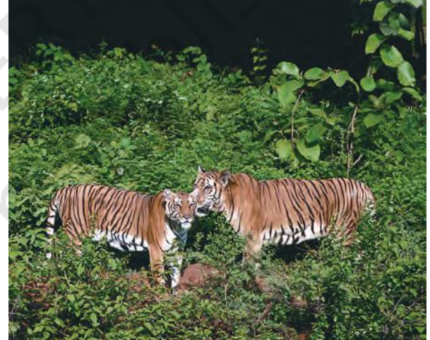
चित्र 1.3 भारत के विभिन्न चिड़ियाघरों में वन्य प्राणी