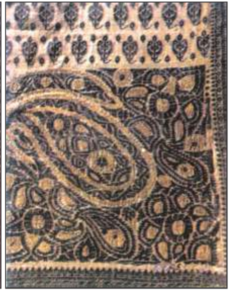
जामदानी बुनाई का नमूना

पहला प्रहार भारत के वस्त्र उद्योग पर हुआ। अब इंग्लैंड के सूती वस्त्र उद्योग को विकसित करने के लिए भारतीय निर्माताओं के साथ आयात निर्यात करने में भेदभाव का सिलसिला शुरू किया गया। अंग्रेजी सरकार का यह उद्देश्य था कि ऐसे कानूनों को बनाया जाए, जिनके सहारे भारत से कच्चे माल का आसानी से निर्यात किया जा सके और तैयार माल को भारत में बेचा जा सके। मशीनों की वजह से अधिक उत्पादन होने लगा। अब वे इंग्लैंड में ही नहीं, बल्कि भारत में भी बाजार खोजने लगे, ताकि उनके उत्पादित कपड़ों की खपत हो सके। अतः इंग्लैंड के व्यापारी अब इंग्लैंड का कपड़ा लेकर भारत में बेचने के लिए आने लगे। इस समय तक इंग्लैंड का उद्योग काफी उन्नति कर चुका था, जिससे भारत में भी सस्ते दामों के कारण मशीनों द्वारा बने हुए कपड़े बिकने लगे। मुक्त व्यापार की नीति एक तरफा नीति थी। भारत से जो सामान इंग्लैंड जाता था, उस पर वहाँ आयात कर लगता था, लेकिन जो सामान भारत में आता था, उस पर कोई कर नहीं लगता था।