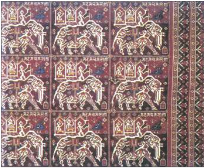
चित्र 2 – पटोला बुनाई का नमूना