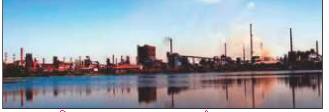
चित्र 6 – टाटा आयरन एण्ड स्टील कारखाना

सन् 1855 ई० में बंगाल के रिशरा में पहली जूट मिल स्थापित की गयी। इसी तरह सन् 1906 में कोयला खान उद्योग की शुरुआत भी की गयी।