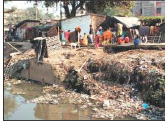
चित्र 8 - मजदूरों का आवास

मजदूरों को समय पर वेतन का भी भुगतान नहीं होता था। अगर मशीन खराब हो जाय या माल कम तैयार हो तो इसमें मजदूरों की कोई गलती नहीं होती थी, फिर भी मालिक उनके वेतन से कटौती कर लेता था। इतना ही नहीं यदि मजदूर की तबियत खराब हो जाती थी, तो उसकी चिकित्सा की व्यवस्था करना तो दूर, उस दिन काम पर नहीं आने के कारण उसके वेतन में कटौती कर ली जाती थी।