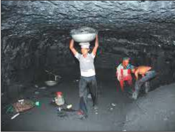
चित्र 7 - कोयला खदान में काम करता श्रमिक

भारत में सूती कपड़ा उद्योग का मुख्य केन्द्र बंबई था, जूट और चाय उद्योग का मुख्य केन्द्र बंगाल था। यहाँ श्रमिकों की संख्या भारत में सबसे अधिक थी। उनके रहने और कार्य करने की परिस्थितियाँ बहुत शोचनीय थीं। वे एक दिन में 15-16 घंटे से लेकर 18 घंटे तक काम करते थे। अवकाश की कोई व्यवस्था नहीं थी। उनके रहने की जगह भी अच्छी नहीं होती थी। वे कारखानों के बगल में ही स्थित छोटी-छोटी झुग्गी झोपड़ियों में रहते थे, जहाँ सफाई एवं पानी की कोई भी सुविधा उपलब्ध नहीं थी।