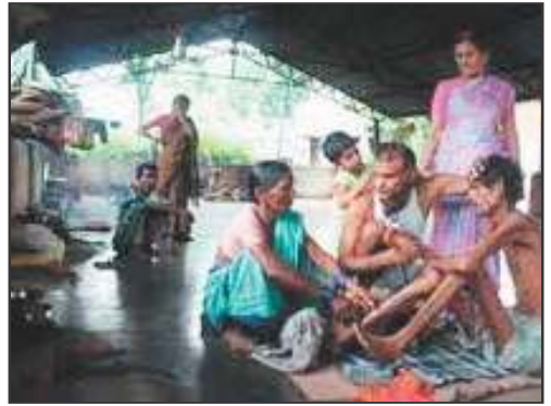
चित्र 9 – श्रमिकों का जीवन

करना पड़ता था। एक तरफ काम का बोझ होता था, दूसरी तरफ रोजगार की कोई सुरक्षा नहीं होती थी। ऐसी परिस्थिति में मजदूरों के पास संगठन बनाने एवं अपनी मांगों को सरकार के समक्ष रखने के अलावे कोई उपाय नहीं था। लेकिन इससे उसकी नौकरी चले जाने का भय था। सन् 1880 में बिजली के बल्ब के लग जाने से काम के घंटे में और वृद्धि होने लगी। अतः मजदूरों ने अब उद्योगपतियों के खिलाफ जगह-जगह पर विरोध प्रदर्शन करना शुरू कर दिया। उनकी प्रमुख प्रारंभिक मांगें थीं— काम के घंटों में कमी, साप्ताहिक अवकाश और कारखानों में काम के दौरान घायल हुए श्रमिकों को मुआवजा। भारतीय उद्योगपतियों को उनकी मांगें उचित नहीं लगीं, क्योंकि काम के घंटे कम होने से उत्पादन में कमी हो जाती, मालिकों का खर्च बढ़ जाता और कारखानों में बनी वस्तुओं का दाम बढ़ जाता। ऐसी स्थिति में इंग्लैंड की बनी वस्तुएँ सस्ती और भारत में बनी वस्तुएँ महंगी हो जातीं और भारतीय उद्योग का विकास धीमा पड़ जाता।