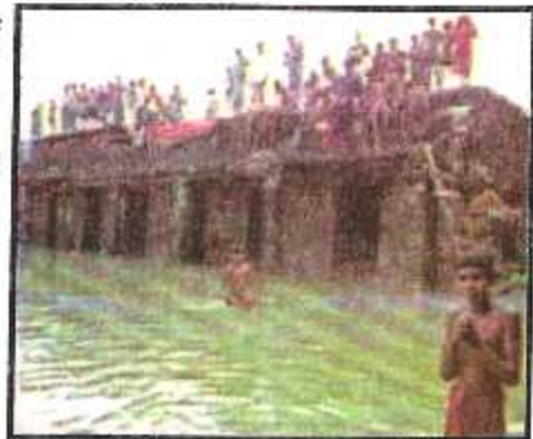
बाढ़ के कारण आम जन-जीवन अस्त-व्यस्त हो जाता है।

है तो अनेक ऐसे क्षेत्र भी जल प्लावित हो जाते हैं जहाँ पहले बाढ़ की संभावना नहीं थी। 2008 ई० में भारत-नेपाल की सीमा पर कुसहा के पास तटबंध के टूटने से आई बाढ़ ने कोसी की धारा ही बदल दी थी।