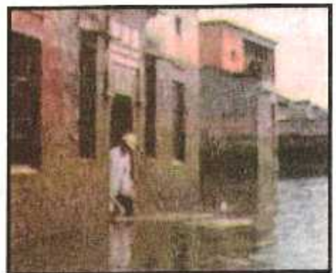
बाढ़ के कारण आम जन-जीवन अस्त-व्यस्त हो जाता है।

बाढ़ तो प्राचीन समय से ही आते रहे हैं। भारतीय धर्म ग्रंथों के अनुसार वर्षा के देवता इंद्र हैं। इनके क्रोधित होने से ही भारी वर्षा और बाढ़ जैसी आपदा आती है। हाल के वर्षों में बाढ़ की स्थिति मानवीय कारणों से भी उत्पन्न होने लगी है। बाढ़ को रोकने के लिए बाँध और तटबंध बनाये गये हैं, लेकिन नदी का बढ़ता जल स्तर जब इन्हें तोड़ देता